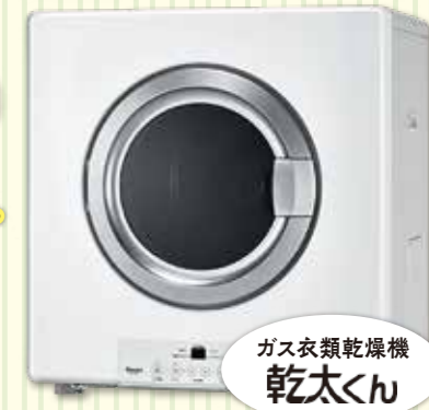
ガス衣類乾燥機 乾太くん

仕事に集中するため、家事の時間と疲れることを少しでも減らしたいという思いが強いので、乾太くんは本当に心強い味方になっています!